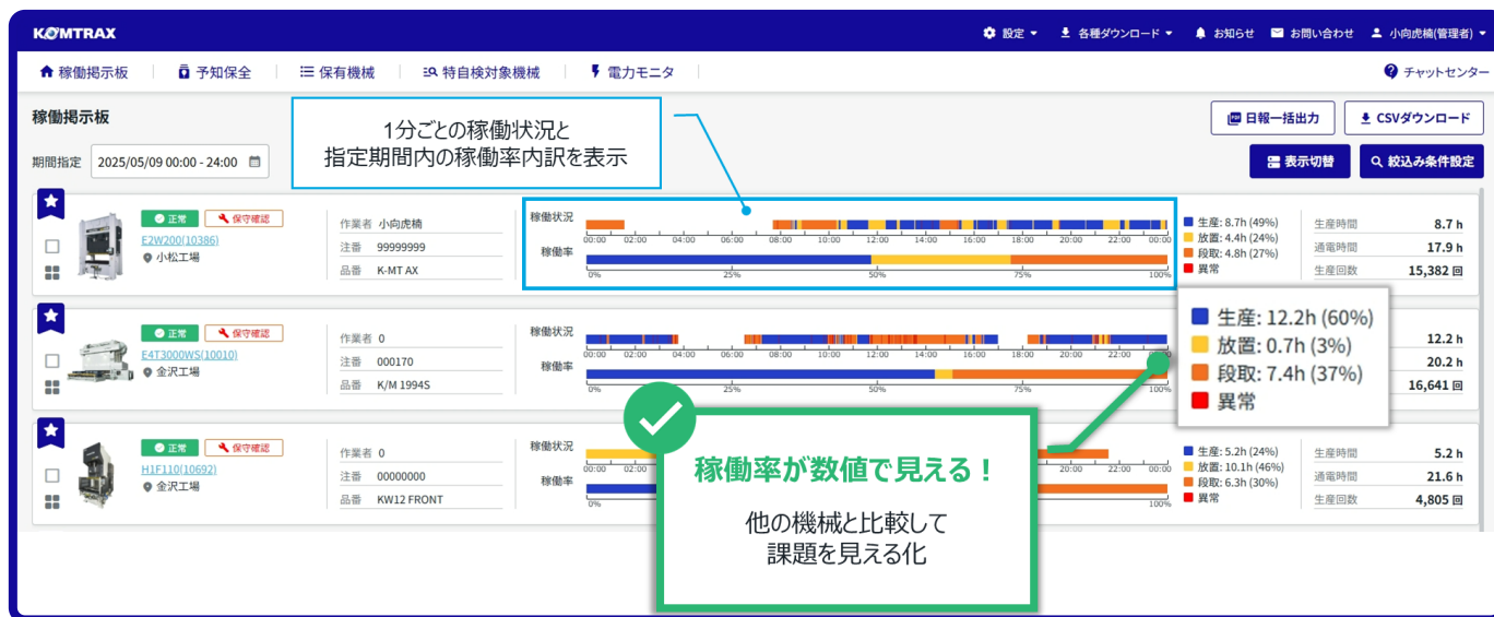
▲ リニューアル後の稼働掲示板画面イメージ

デザイン・機能を一新し、より見やすく、使いやすく生まれ変わります。既存のURLからそのままご利用いただけます。